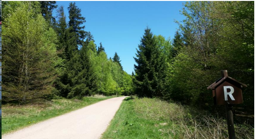
15.09.2018 - Marathon 1 Zum InselsbergTower 1036 üNN (40 km, 1253 hm)